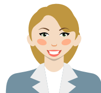
SALARIÉS EN MUTATION